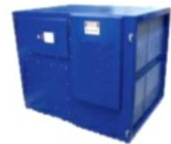
AirMex T 5200

Thermische Verbindungsprozesse: Spritzguss Schweißrauch Kunststoffschweißen Lötrauch