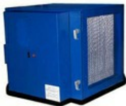
AirMex T 1001