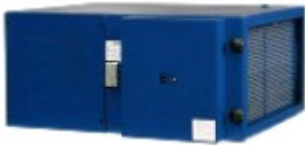
AirMex T 1300