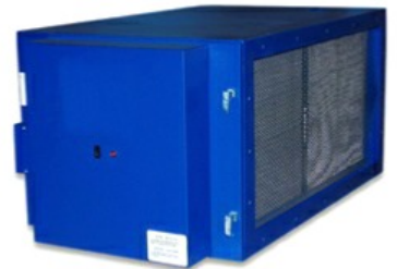
AirMex T 2002

Die AirMex T-Serie sind hochwirksame Elektrofilter, die für jede Anforderung zur Luftreinhaltung in Handwerk, Gastronomie, Industriebetrieben und in RLT-Anlagen die optimale Lösung bieten. Die AirMex T-Serie gibt es in zwei Gerätevarianten. 1. Die T-Serie mit eigenem Motor: Die Modelle T 1300, T 2600 und T 5200 sind Kompaktelektrofilter zur Direktabsaugung oder zur frei hängenden Montage. Sie werden eingesetzt zur Abscheidung von Ölnebeln, Rauchen und sonstigen Luftverschmutzungen. Die Geräte sind mit robusten, riemengetriebenen Radialventilatoren ausgestattet. Vierpolige Normmotoren dienen als Antrieb. Luftverteilung: durch 4-fach verstellbares Lüftungsgitter am Luftaustritt. 2.