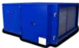
AirMex T 2600

Nachfilter: Engmaschiger Aluminiumgestrickfilter. Gehäuse: Stabile Stahlblechkonstruktion mit vier Aufhängepunkten. Ein Ablaufanschluss für eine Ölnebelabwendung ist vorgesehen. Die Geräte sind mit einer Polyester-Pulverbeschichtung lackiert. Farbe: ähnlich RAL 5007. Luftrichtung: Alle AirMex T-Modelle können wahlweise in Luftrichtung Links/Rechts oder Rechts/Links mit Blick auf die Wartungstür geliefert werden. Hochspannungsversorgung: Getaktetes Hochfrequenzsystem im Schaltschrank auf der Wartungstür mit integriertem Türsicherheitsschalter. Zudem Anzeige durch LED-Kontrollleuchten sowohl für den Hochspannungsbetrieb als auch für den Gerätebetrieb.