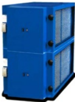
AirMex T 4002

Spanabhebende Bearbeitung Ölnebel Emulsionsnebel Erodiernebel Ölrauch